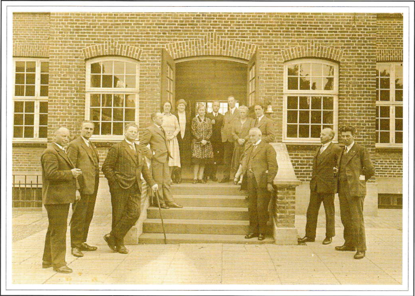
Åby skoles lærerstab mellem 1930 og 1934