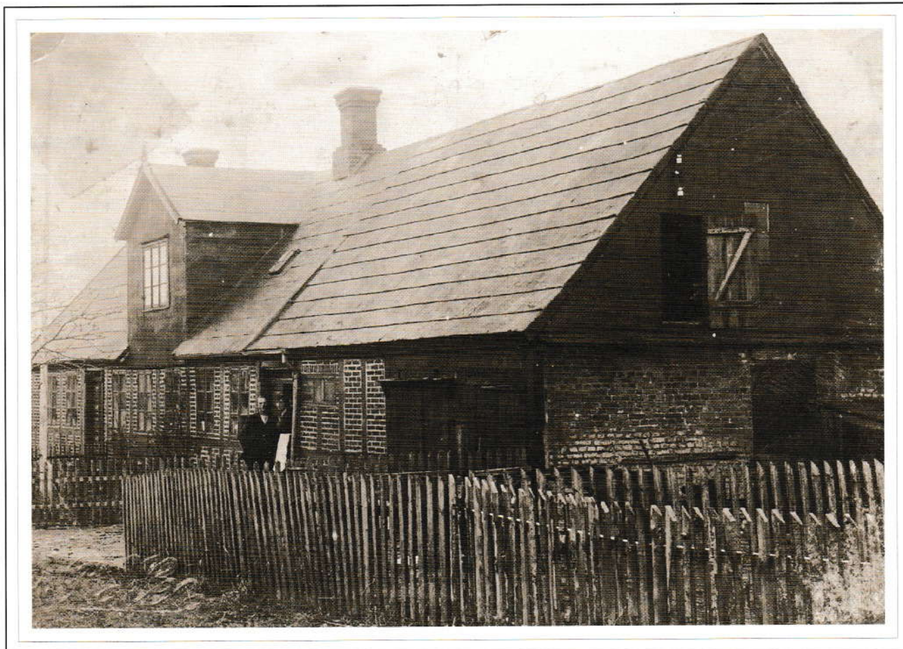
De gamle gårde.

Den første udskifning af gårdene i Åby blev foretaget allerede 1779-80, før det blev vedtaget ved lov i 1781. Fordi man i Åby var på forkant med udviklingen, blev udskifningen foretaget dårligt på grund af manglende erfaring. I 1822 blev Lyngbygårds 16 fæstegårde udskiftet, og 8 af dem blev bestemt til udflytning på marken. Efterhånden fulgte flere med, og i de tiloversblevne stuehuse i Åby indrettede husmænd og arbejdere sig. På billedet fra omkring 1910 ses Kærvej 6 og 8, som oprindeligt har været stuehus til den gård, der i matriklen fra 1844 fik nummer 14.