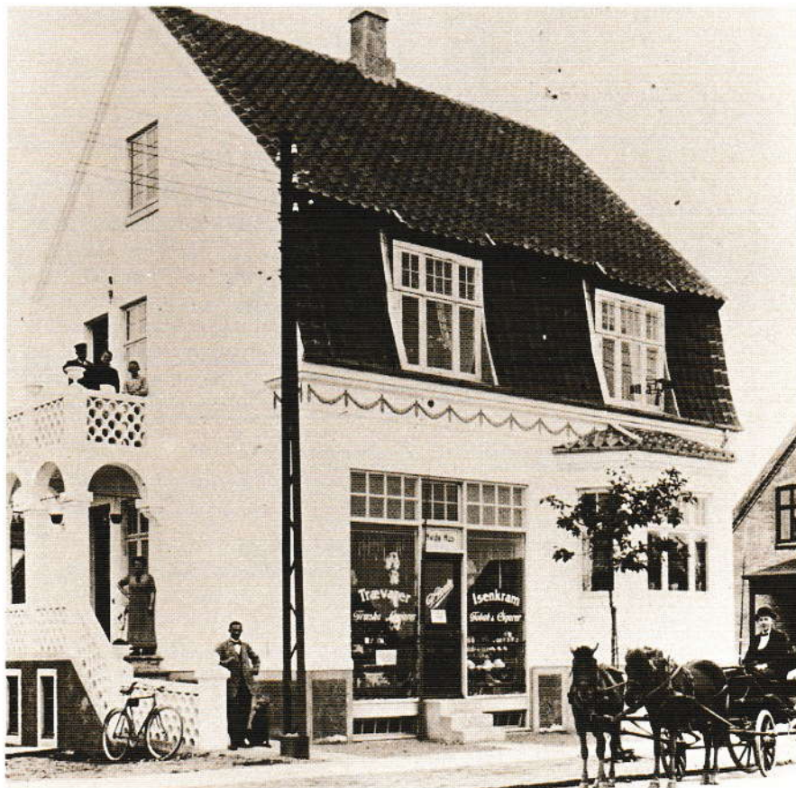
Forretningerne vinder indpas.

Efter ophævelsen af det løvbælte, som indtil 1903 skulle lette overgangen til fri næring for handelslivet i Århus, blomstrede forretningslivet op i Åby sogn for at kulminere i tiden lige efter Anden Verdenskrig. Billedet, der stammer fra 1918, viser forretningen i Det Hvide Hus på Silkeborgvej 234. Dengang handlede man med isenkram, trævarer, træsko og tobak. I 1958 indrettedes her provinsens første mejeriudsalg med selvbetjening. Mælkehandlere fra hele landet kom rejsende for at tage dette moderne forretningsfænomen i øjesyn. I dag rummer bygningen en frisørsalon, og i kælderen har Århus Stiftstidende depot.