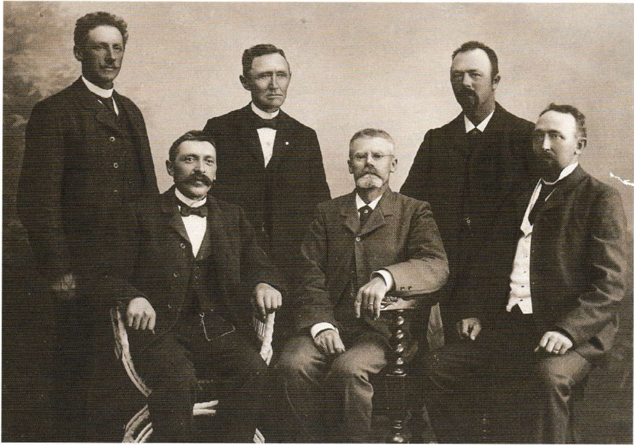
Åby sogneråd 1905.