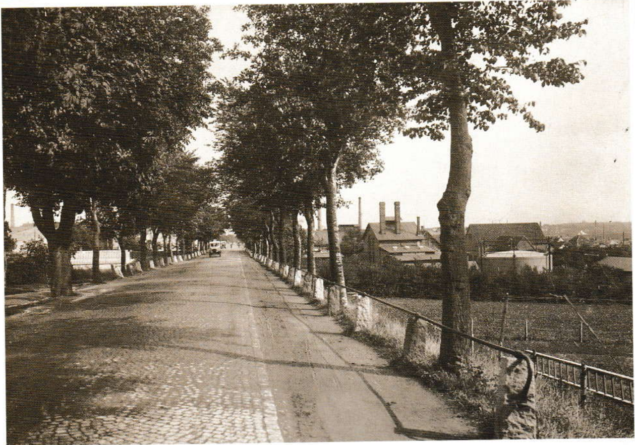
Åby Kommunale Værker.

Åby Kommunale Værker fik en stormfuld fødsel. I 1910 blev det besluttet i samarbejde med Viby og Brabrand at forsøge at etablere et fælles gasværk, og der blev skrevet kontrakt med Skandinavisk Gasværks Kompagni. Forhandlingerne med dette firma og Viby og Brabrand sogneråd brød dog sammen, og firmaet måtte betale en bod på 5000 kr. for kontraktbrud. Oktober 1911 blev arbejdet af Åby sogneråd overdraget et helt andet firma. Værket med tilhørende vandværk stod færdigt sommeren 1912. Elektricitetsværket kom til i september året efter. Produktionen af gas stoppede i 1970. Billedet, som er fra ca. 1925, viser værket bag landevejstræerne til højre i billedet.