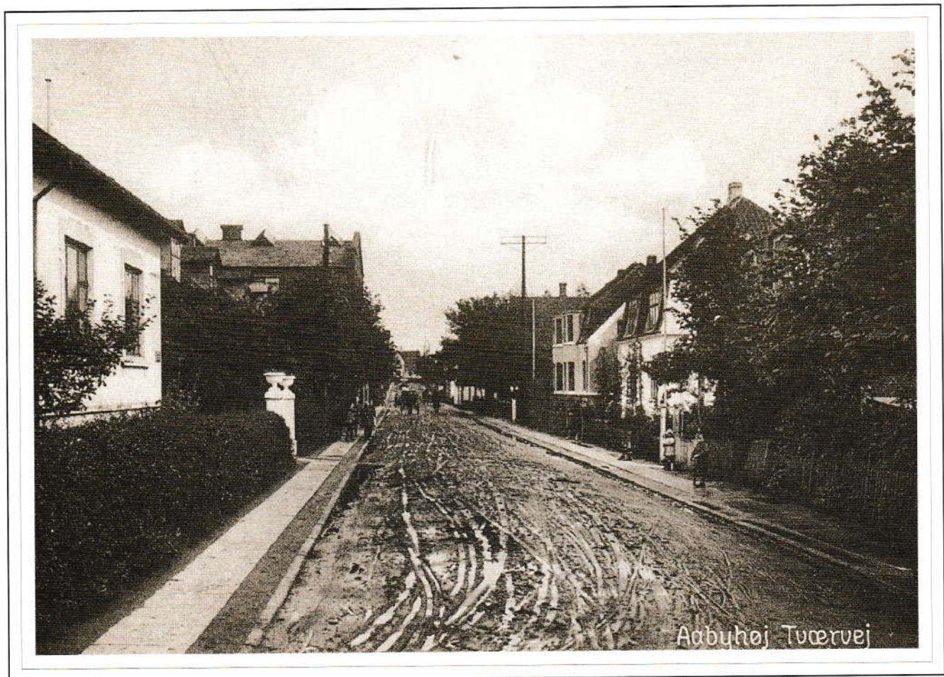
Tværvej, nu Bjarkevej.

Åbyhøjs vækst efter 1900 var enorm. Særlig kraftig synes væksten at have været i 1920-erne, hvor den ene villa efter den anden skød op, ofte indrettet med to lejligheder, så den nyslåede husejer kunne bo lidt billigere. Årsagen til tilvæksten er naturligvis alle de mange store fabrikker, som flyttede produktionen ud fra Århus, der led af pladsproblemer. Billedet viser Tværvej omkring 1925. Vejen er senere omdøbt til Bjarkevej. Kvarteret er et typisk arbejderkvarter med små huse på små parceller, ofte bygget sammen med nabohuset.