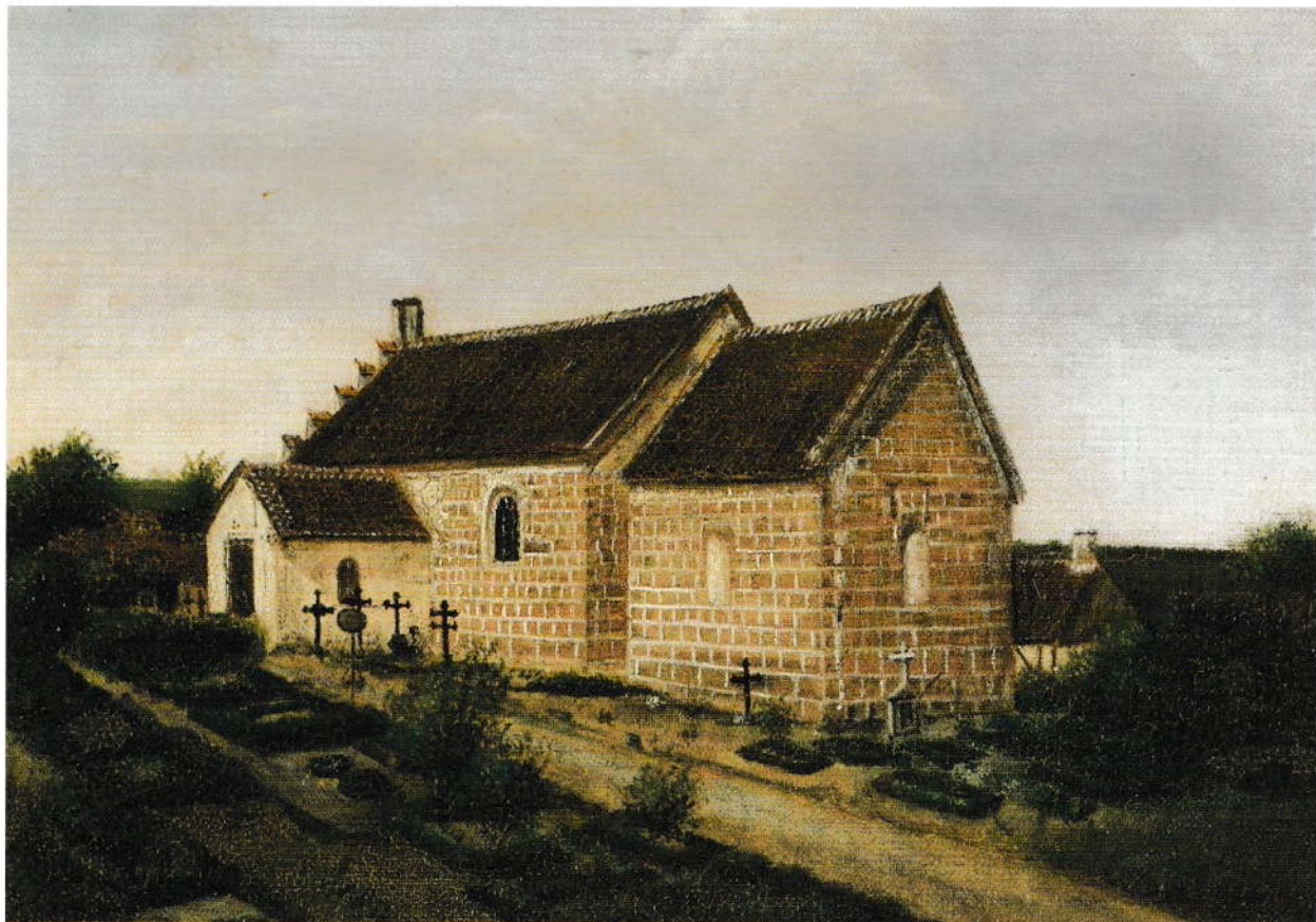
Den ældste kirke i Åby sogn.

I årene omkring 1200 opførte man i Åby en kirke i romansk stil, bestående af skib og kor. Den var bygget af granitkvadre, mens murenes inderside bestod af marksten. Senere forsynedes sydsiden med et våbenhus, og rimeligvis har den gamle kirke også en overgang haft et tårn. Måske på grund af dårlig fundering begyndte især den nordlige mur at skride, og da man frygtede nedstyrtning, blev kirken revet ned, og 1872 lagde man grundstenen til den nuværende Aaby kirke. Denne har i sine ydermure en del kvadre, som stammer fra sognets første stenkirke. kopieret efter maleri af Emmy Bech. (Originalen hænger i dåbsværelset i Aaby kirke).