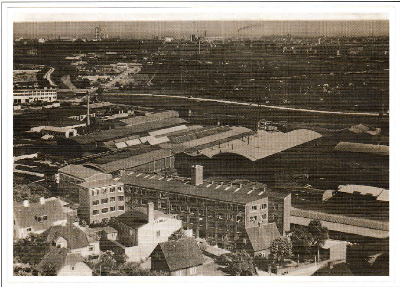
Åbyhøj som industriby.

I første del af 1900-tallet blev Åbyhøj en by præget af betydelige industrivirksomheder. Blandt disse var indtil lukningen i 1979 Frichs Fabrikker, som en overgang havde 1200 medarbejdere. Bygningerne, der nu bærer navnet Frichsparken, er i dag hjemsted for utallige former for virksomhed.