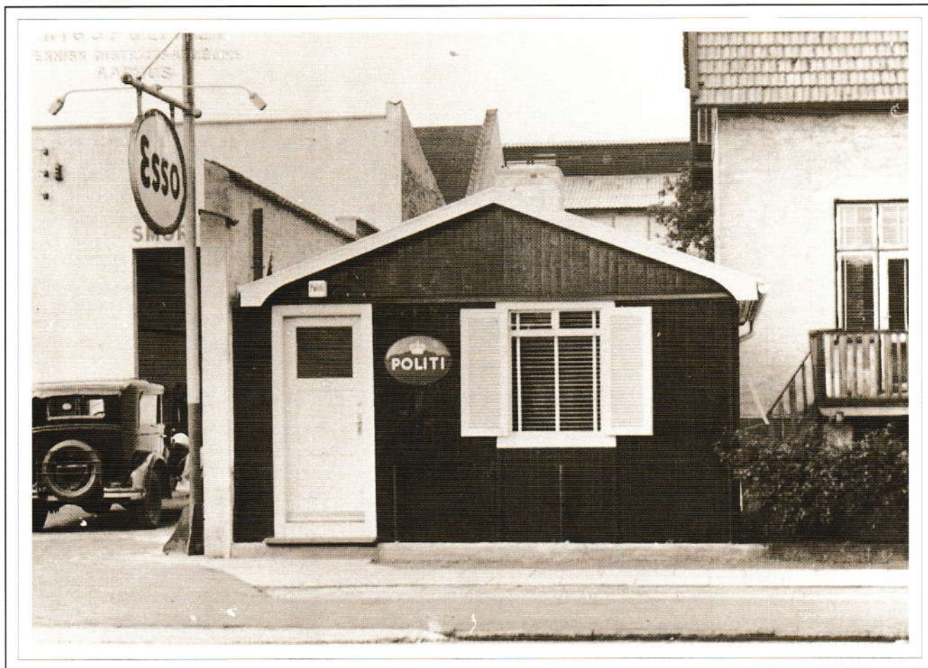
Åbyhøj får eget politi.

I 1922 fik Åbyhøj sin første politibetjent, der indrettede en celle i sin villa på Carit Etlarsvej. Men egen politistation fik byen først i 1949, og samme år købte justitsministeriet en tidligere tysk barak, der blev opstillet på Silkeborgvej 244, hvor det nuværende posthus ligger. Her holdt politiet til indtil 1951, da adressen blev Silkeborgvej 264. I 1954 blev stationen flyttet til det tidligere posthus på Torvet og havde, da bemanningen var størst, et personale på 12, men efter omlægningen af politikredsene i 1973 blev Åbyhøj politistation en distriktsstation med et personale på fire mand.