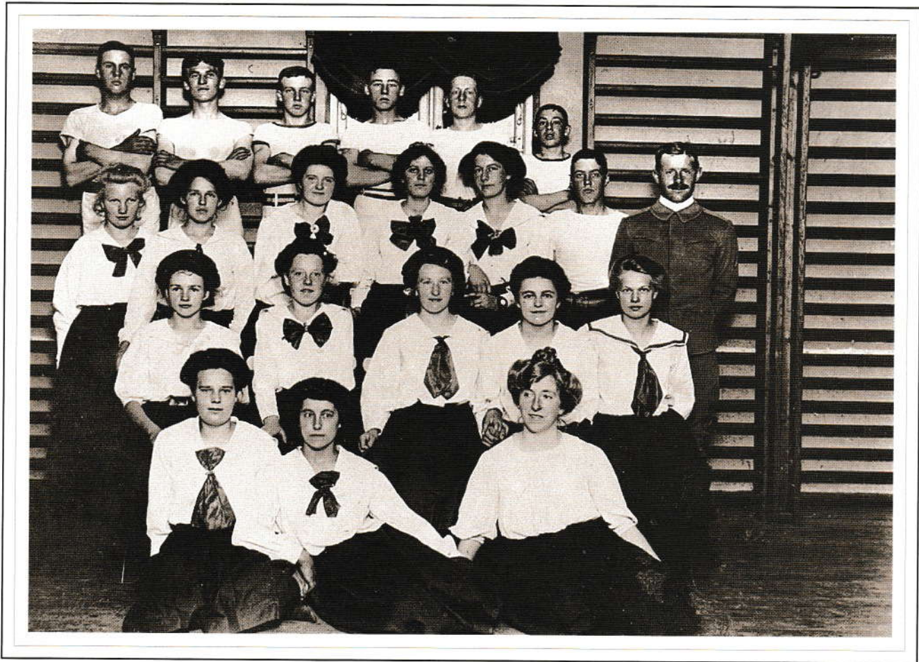
Gymnastik i 1912.

Straks efter at Åbyhøj var begyndt at blive bebygget omkring århundredskiftet, dukkede de første foreninger op. Heriblandt gymnastikforeninger: I sognerådets forhandlingsprotokol findes den 9. september 1909 en ansøgning fra