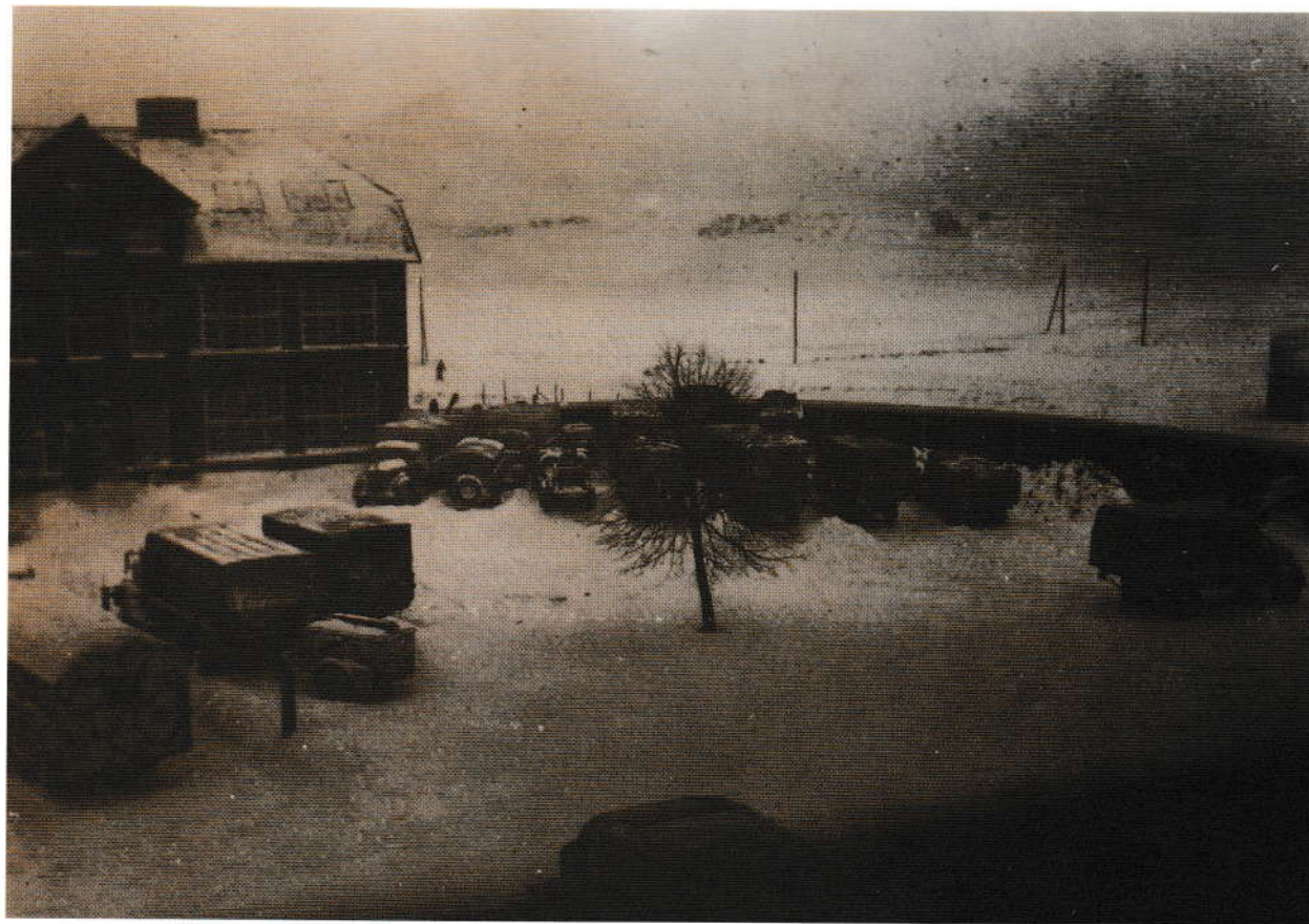
Tyske biler i Åby skoles gård i februar 1945

I de første besættelsesår så man ikke meget til tyske tropper i Åby. Men i august 1943 beslaglagde Væmemagten missionshuset Tabor, i første omgang dog kun for en kort tid. I december 1944 returnerede tyskerne til Tabor, og i foråret 1945 beslaglagde de salen på Elka (nu Åbykroen) og anvendte den som hestestald!