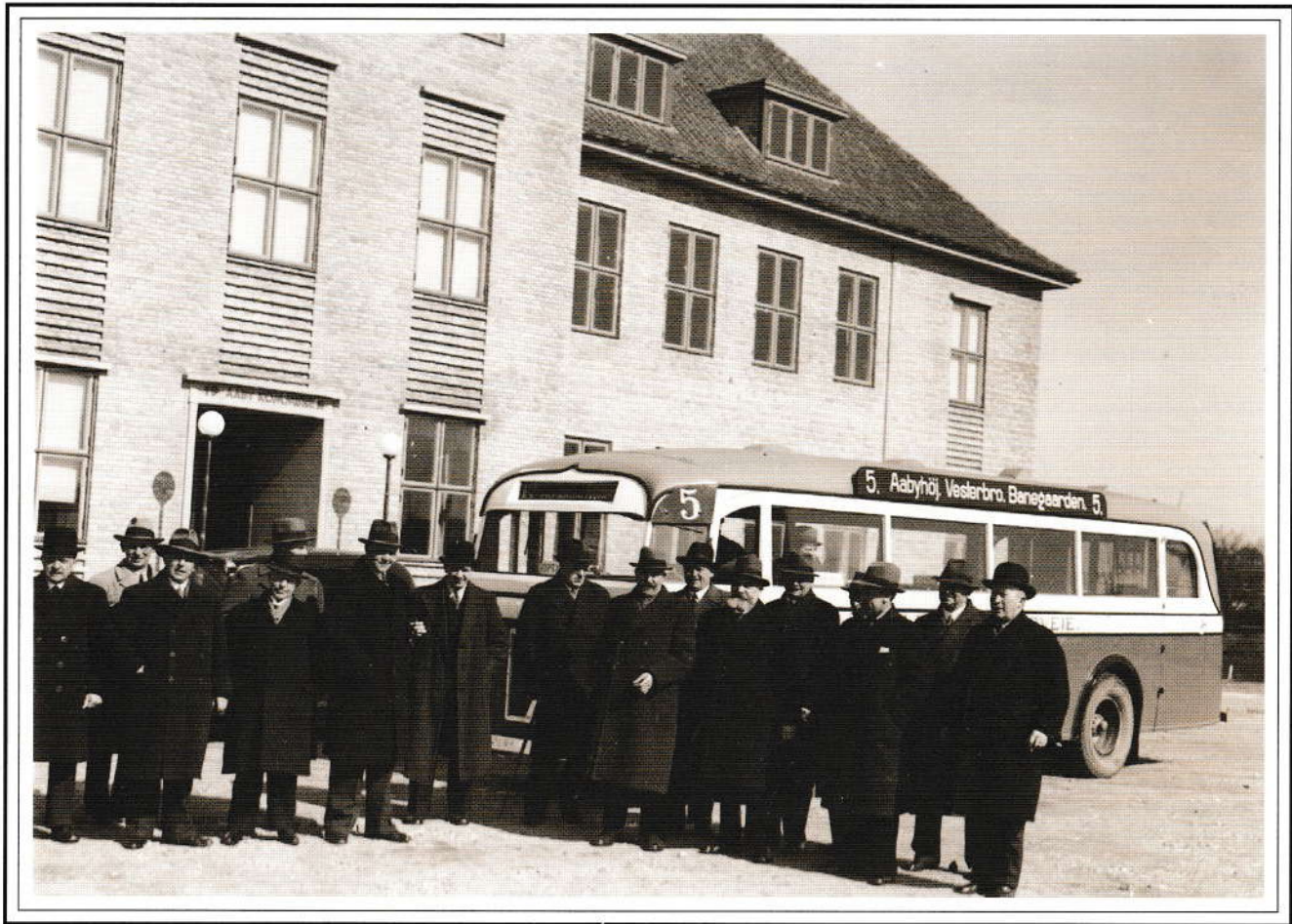
Linie 5 til Åbyhøj.

Den første april 1937 overtog Århus Sporveje efter et længe næret ønske fra Århus by den trafikale forbindelse mellem Århus og Åbyhøj, men det skete først efter en lang debat, hvor Århus næsten til det sidste holdt på, at linie 5 skulle starte ved Immervad. Her fik Åbyhøj dog sin vilje, idet ruten kom til at gå fra Banegårdspladsen og til Tousvej for snart at blive forlænget til Gammel Åby. På billedet ser man repræsentanter for sognerådet i Åbyhøj og Århus byråd foran administrationsbygningen ved rutens indvielse.