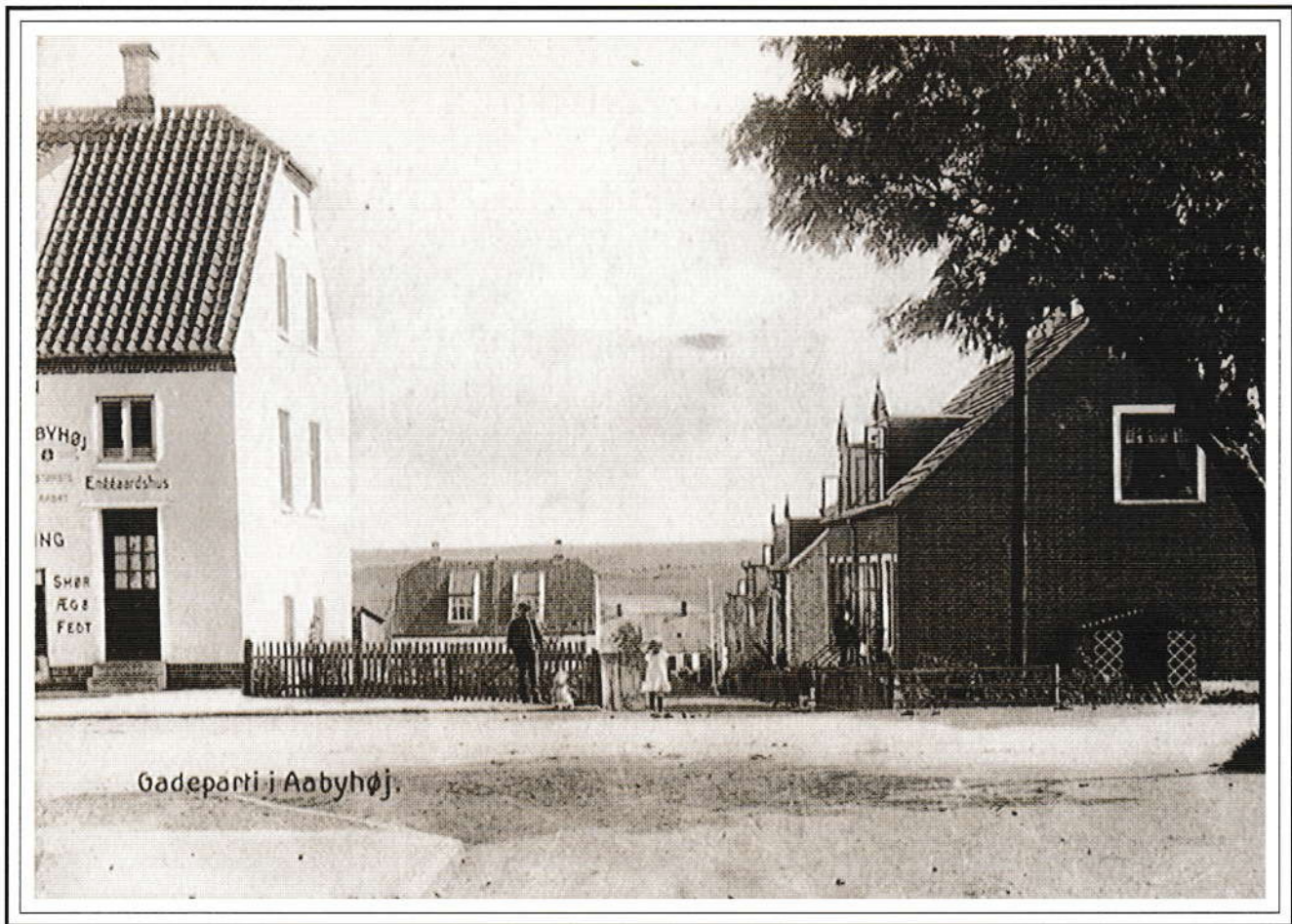
Enggårdsvvej set fra Silkeborgvej.