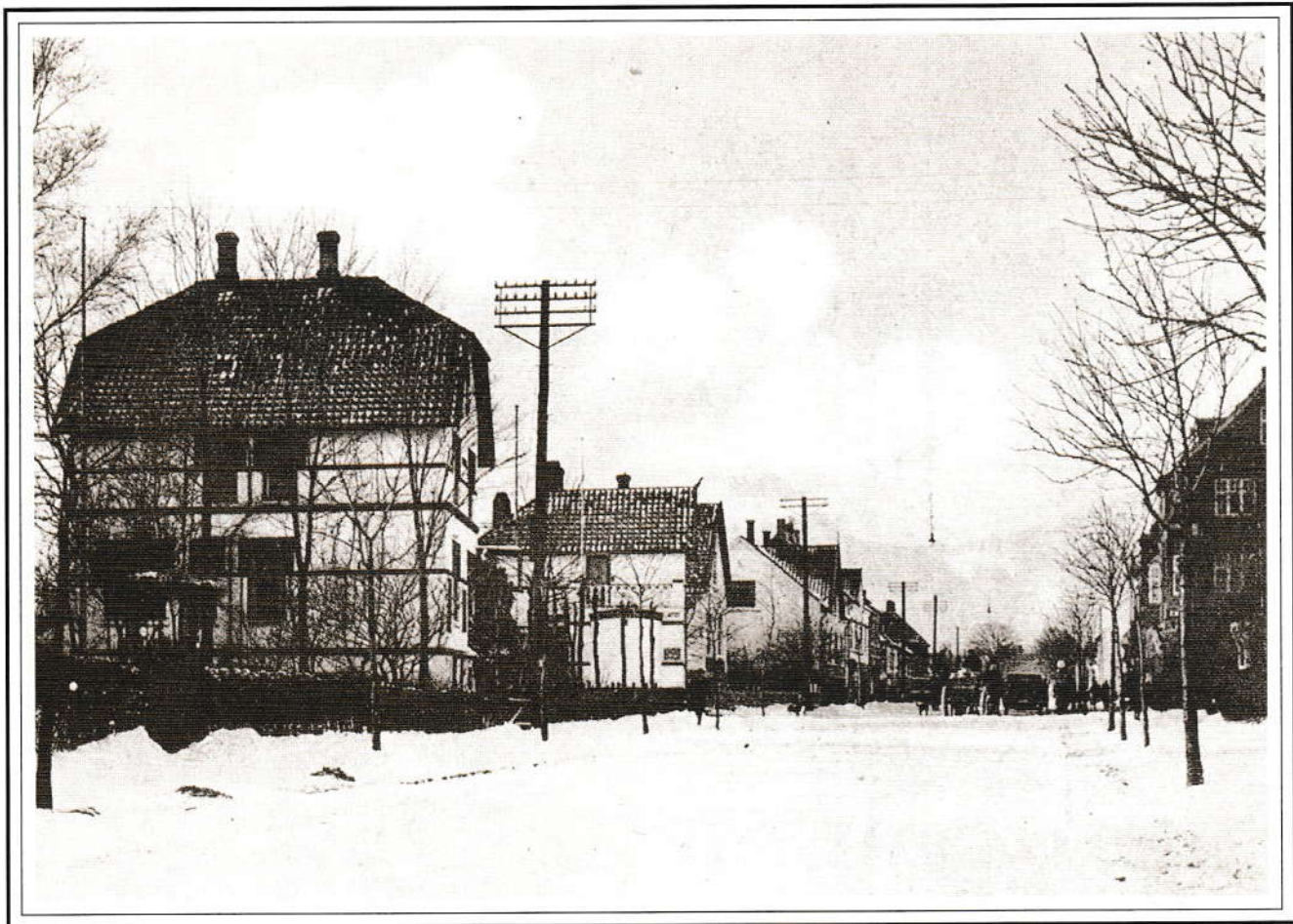
Silkeborgvej, set fra østsiden.