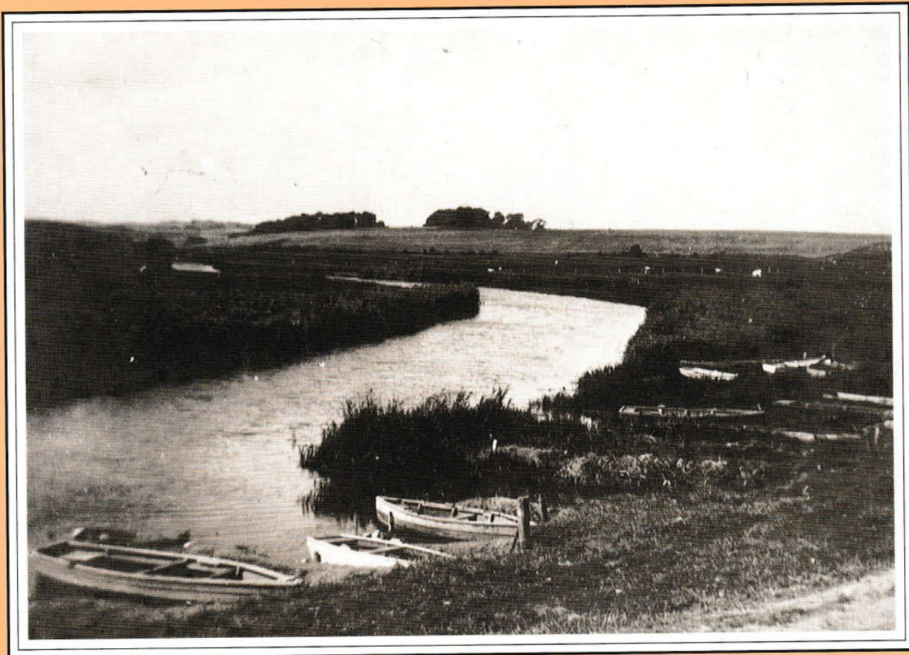
Bådhaaven ved Åby omkr. 1930.

Åbys historie som landsby kan føres tilbage til i hvert fald vikingetiden, og måske har den ældste havn i Århusdalen ligget ved Åby: byen ved åen. Senere er havnen flyttet ud til åens munding: Aros, hvor Århus voksede frem, men helt op til udskiftningen i 1822 var der deklareret adgang til landingspladser ved åen. Og langt ind i vort århundrede er stedet blevet anvendt til landing af siv og rør, hentet ved Brabrand sø og anvendt til sivsko, sivmætter og rørvæv.