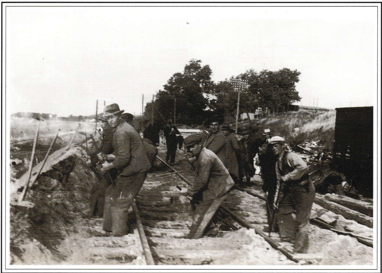
Bygningen af dobbeltsporet ved Åby 1935.