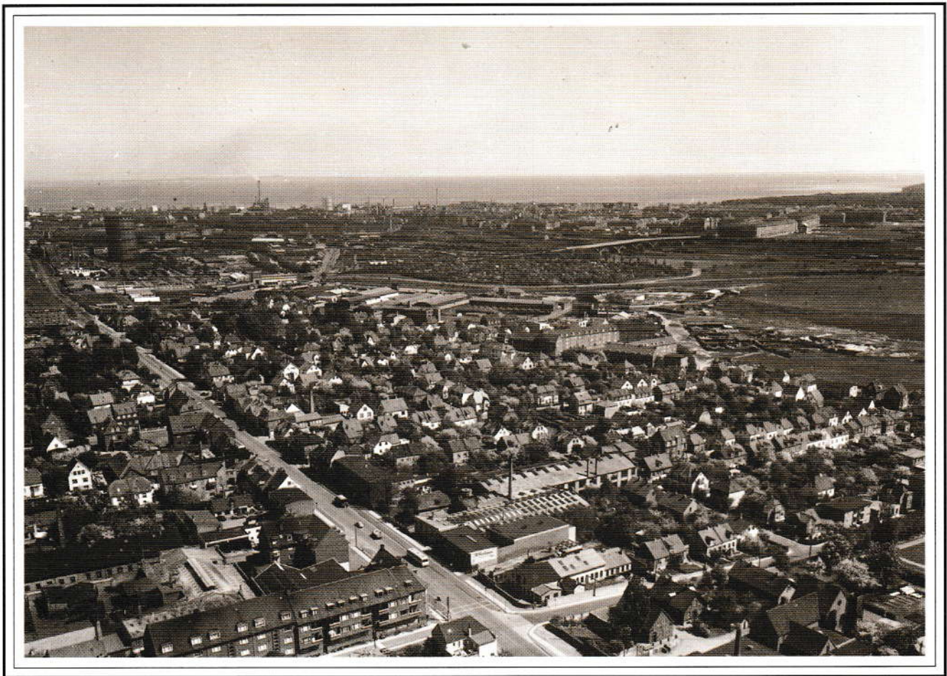
Udsigt over Åbyhøj fra vest-nordvest.

Silkeborgvej er hovednerven gennem Åbyhøj. Den blev anlagt i 1854, efter at Silkeborg var blevet oprettet som handelsplads ved kgl. reskripter i 1845 og 1846. Byen var i kraftig vækst på grund af papirfabrikken, der blev oprettet i 1844, så der var et naturligt behov for veje. Før den tid havde vejen gået fra Århus gennem Hasle og videre til Brabrand, Ry og derfra vestpå. Fra gammel tid havde der eksisteret en gangsti til Ry gennem Åby, men den blev i 1829 lukket af politimesteren i Århus.