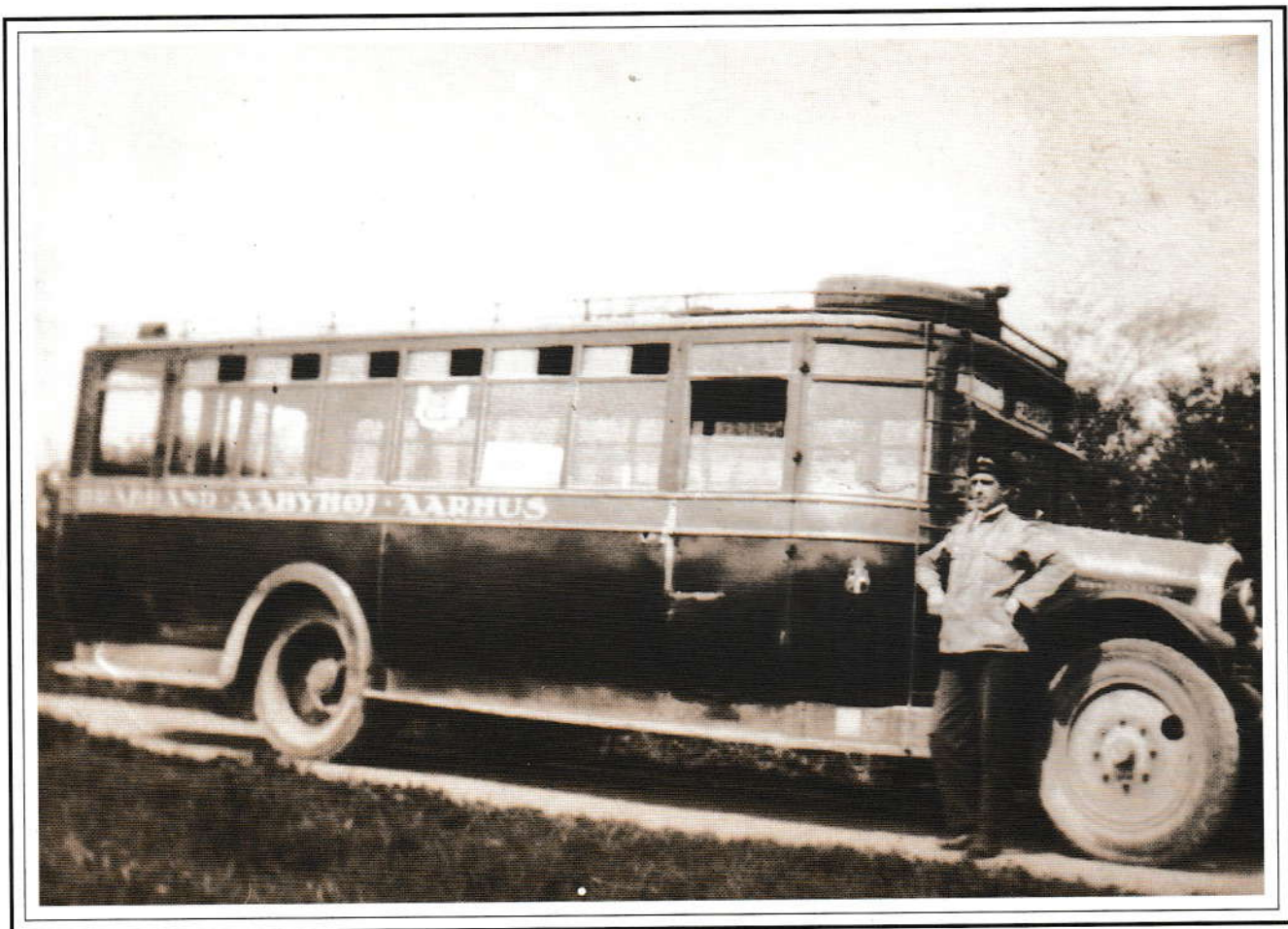
Forbindelsen til Århus.

Åbys nære beliggenhed ved Århus gjorde i mangfoldige år forbindelsen med storbyen til en rent privat affære. Man kunne gå, ride eller køre i hestevogn. Først i 1903 startedes en dagvognsrute med hesteforspand fra møllen i Åbyhøj og til Vesterbro Torv. Omkring Første Verdenskrig satte motoriseringen ind, og i 1936 havde man i travle timer forbindelse til Århus hvert kvarter.